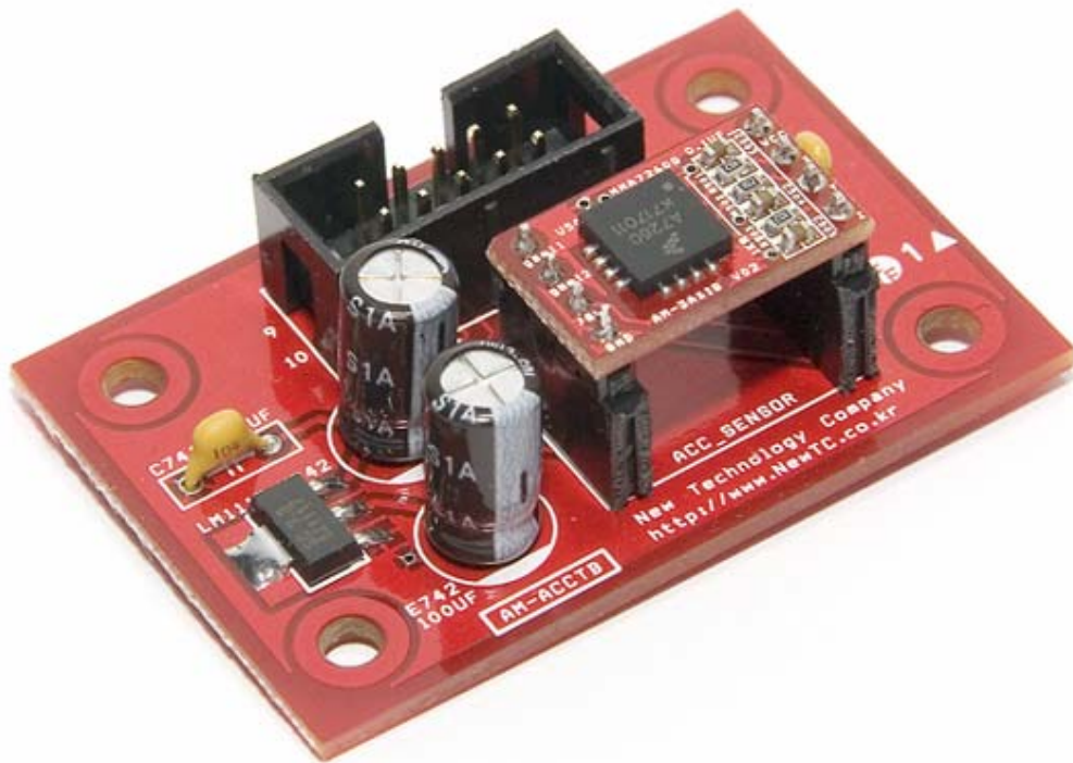
가속도 센서 테스트 모듈 AM-3AXIS-P